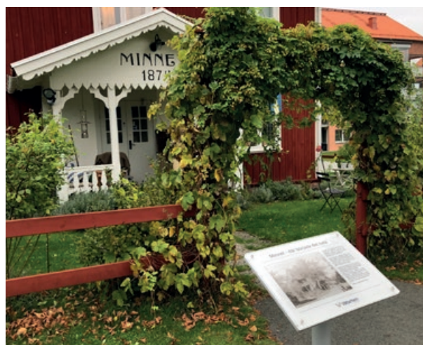
Huset Minnet, äldst av husen på Vilhelmsro.