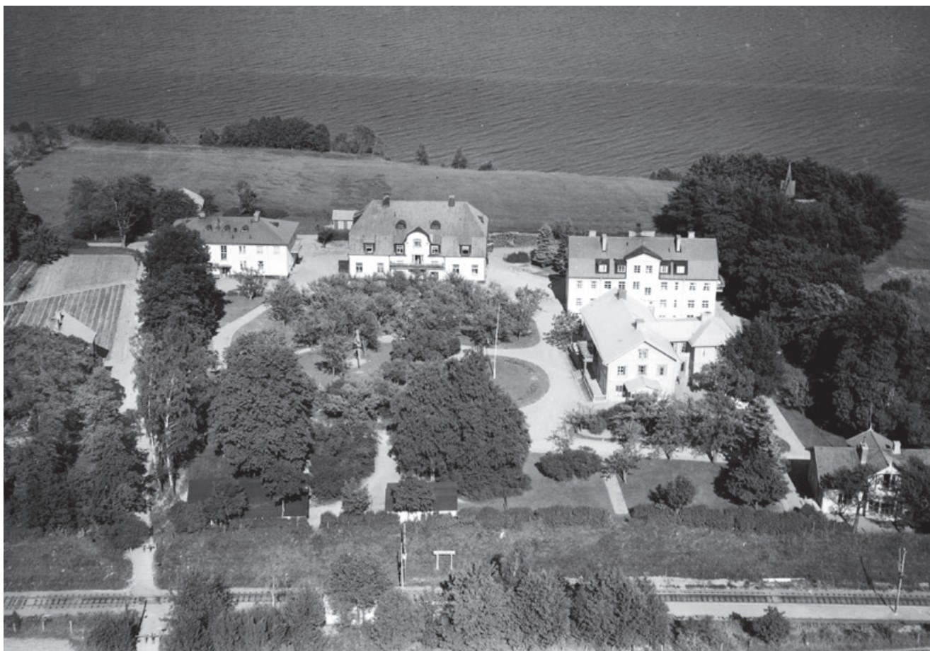
Flygbild på Vilhelmsro på 1940-talet, mellan Vättern och järnvägen. 1939 hade vårdhemmet övergått i statens ägo.