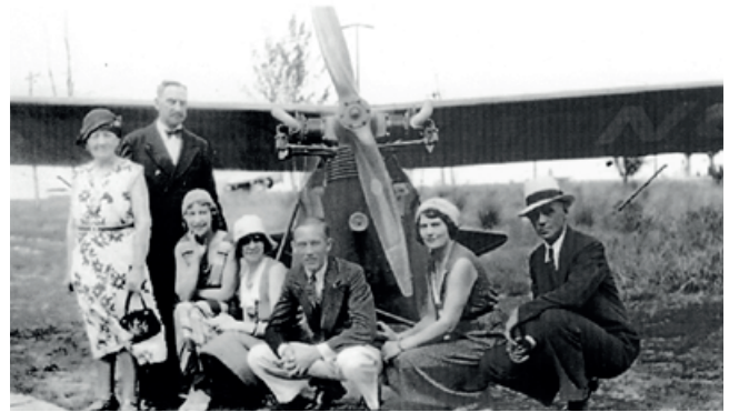
Familjen vid Stures flygplan.

nad? Farmarhustru var det många som blev. Men alla hade kanske inte okända föräldrar.