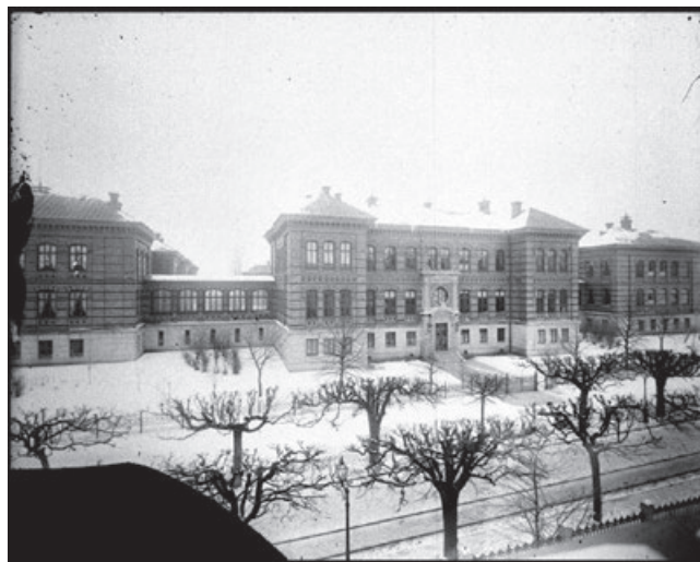
Allmänna barnhuset i Stockholm.