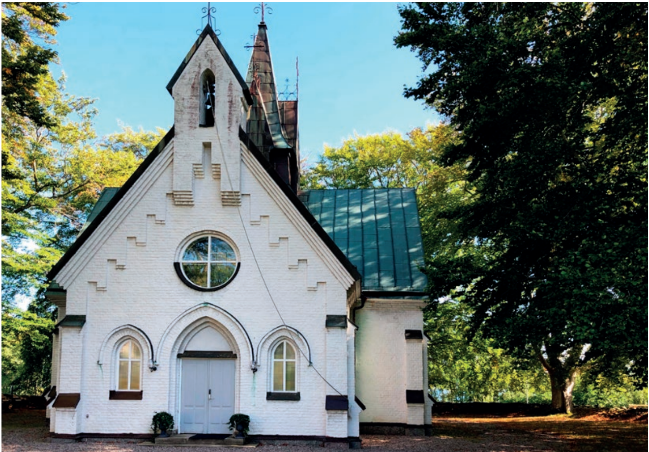
Cecilias kapell, byggt på 1880-talet. Här har flera av barnen från vårdhemmet begravts.