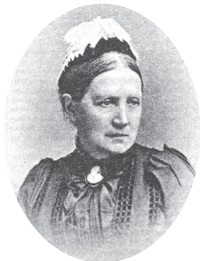
Ebba Ramsay, foto i tidningen Idun 1895. Källa: Svenskt kvinnobiografiskt lexikon. Bild från Wikipedia.