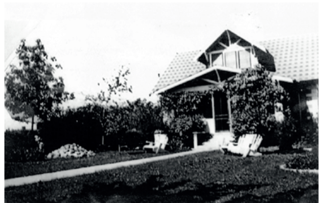
Familjens hus i Amerika.

Det tredje fotografiet visar än en gång familjen men också ett enmotorigt flygplan. På baksidan står: "Här är vi med Stures lilla plain rum för två endast. Han har det för practisera med, så vi alla var uppe i den, han kom till